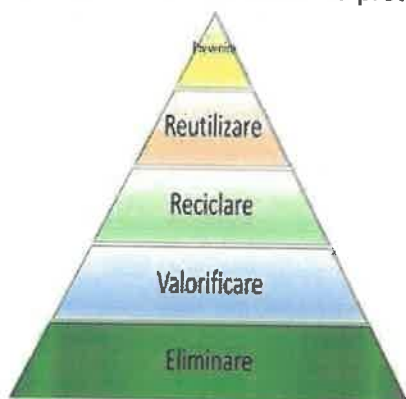
Fig.1 Ierarhia gestionarii deseurilor

Se alege metoda cea mai potrivita pentru a gestiona deșeurile generate. Aceasta practica este o obligativitate specificata in OUG 92/2021. Pentru a gestiona corect deșeurile generate și pentru a le reduce, se opteaza pentru una din operatiunile schemei de ierarhizare a deșeurilor. Obligatia societatii GRANDEMAR SA în calitate de generator și deținător de deșeurii este de a valorifica deșeurile, în măsura în care acestea se pretează acestei operațiuni.