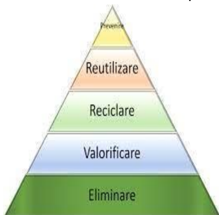
Fig.1 Ierarhia gestionarii deseurilor

Se alege metoda cea mai potrivita pentru a gestiona deșeurile generate. Aceasta practica este o obligativitate specificata in OUG 92/2021. Pentru a gestiona corect deșeurile generate și pentru a le reduce, se opteaza pentru una din operatiunile schemei de ierarhizare a deșeurilor. Obligatia societatii GRANDEMAR SA în calitate de generator și deținător de deșeuri este de a valorifica deșeurile, în măsura în care acestea se pretează acestei operațiuni.